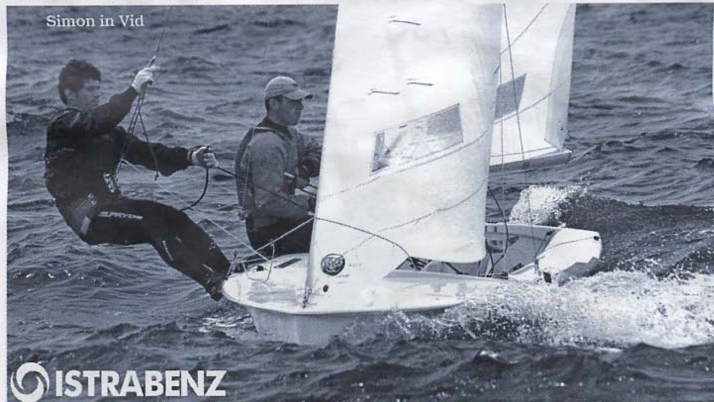
Simon in Vid