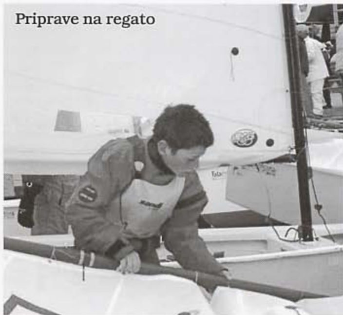
Priprave na regato