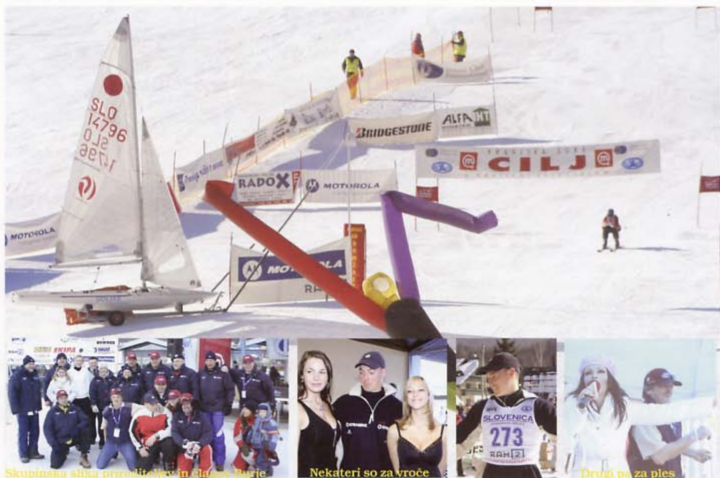
Skupinska slika prirediteljev in članov Burje