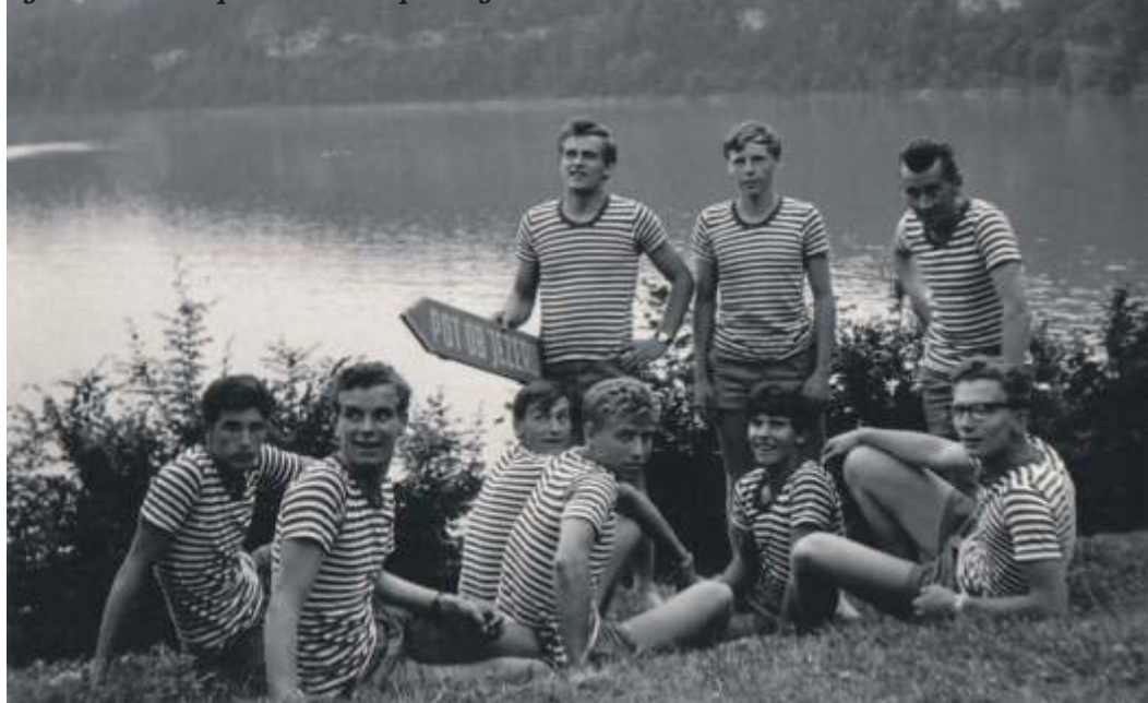
Potovanje na Zbiljsko regato je bila takrat pravcata ekspedicija

Sam bom še naprej aktiven v klubu, tako kot dosedaj. Tu bom pri organizaciji in izvedbi regat. Na noben način pa s tega vidika, še ne mislim v pokoj.